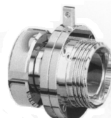
Maschio girella DIN filetto DIN