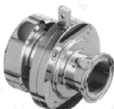
Maschio-girella DIN CLAMP