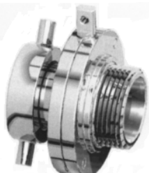
Maschio-girella filetto ENOLOGICO