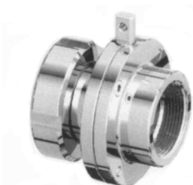
Maschio-girella DIN filetto interno GAS