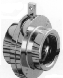
Filetto interno GAS