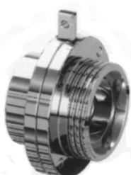
Filetto interno GAS filetto DIN