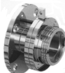
Flangia TONDA filetto DIN