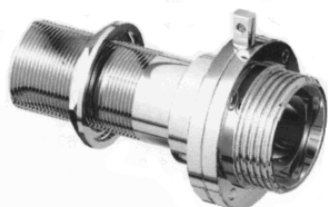
Attacco legno/filetto DIN