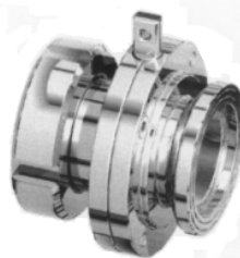
Maschio-girella DIN MORSETTO