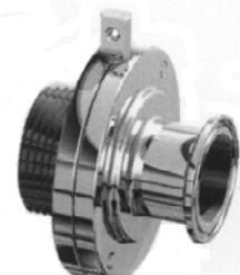
Filetto esterno GAS CLAMP